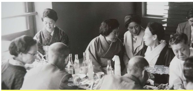
1960年頃 うなぎや円山