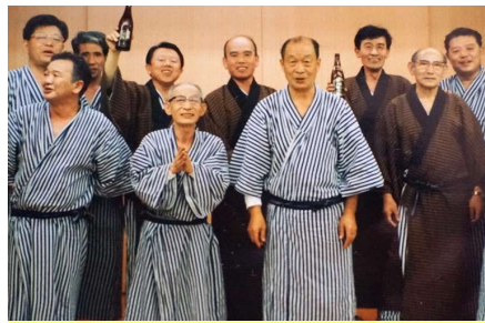
1994年4月 奥湯河原青巒荘