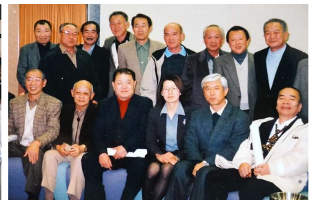
2001年 理事会カンボヘルス