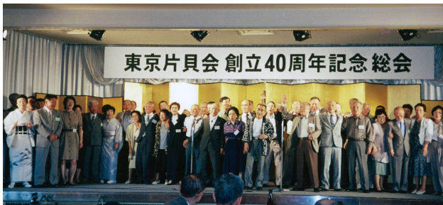
1999年 創立40周年記念総会