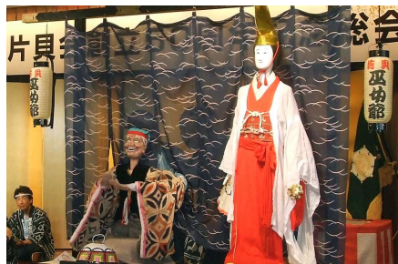
2009年 創立50周年総会巫女翁