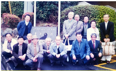
1997年4月 奥湯河原青巒荘