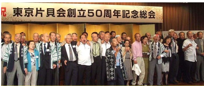
2009年 創立50周年記念総会