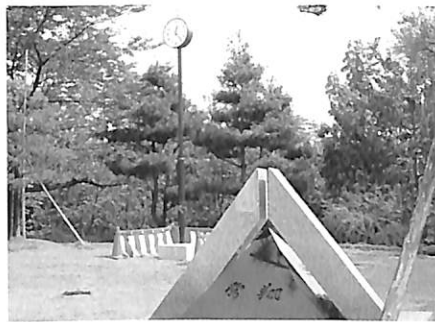
50周年記念のモニュメントと