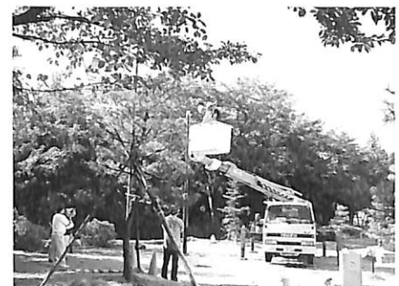
支柱の上へ時計の取り付け