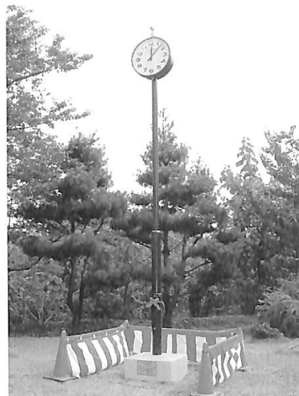
60周年記念品ソーラー式電波時計