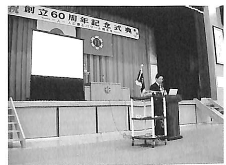
東京片貝会記念講演