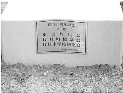
寄贈記念プレート