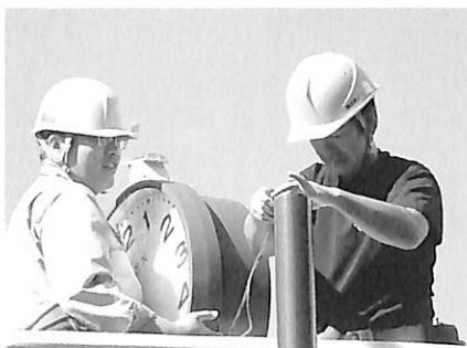
時計取り付け作業の様子