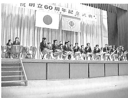
吹奏楽部による演奏